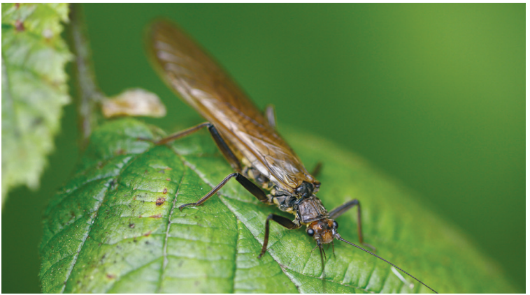
Geschlüpfte Steinfliege

romantisch wirkende Flusslandschaft, aber auch durch menschliche Eingriffe und Einflüsse der Zivilisation. Der Vortrag nimmt Sie mit auf eine Wanderung entlang des Flusses und gibt Ihnen einen Einblick in die Welt unter der Wasseroberfläche. Er weckt Verständnis für die Schwierigkeiten beim Schutz und bei der Entwicklung des aquatischen Lebens in Zeiten des Klimawandels und der Ansiedlung des Otters.