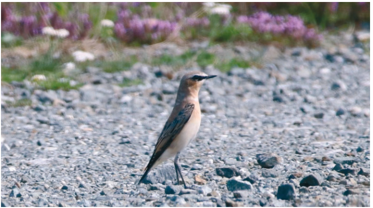
Steinschmätzer | Foto: Andreas Hahn

Treffpunkt: wird nach Anmeldung bekannt gegeben Der Spaziergang findet nicht bei stärkerem Regen statt!